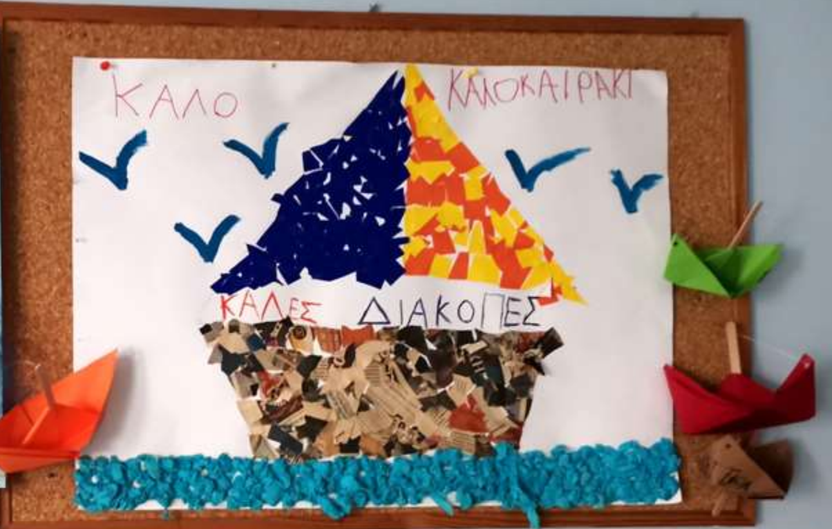
Εμπλουτισμός εικαστικών δραστηριοτήτων και διαμόρφωση εσωτερικού χώρου του Νηπιαγωγείου με κολάζ και κατασκευές με θέμα το καλοκαίρι.