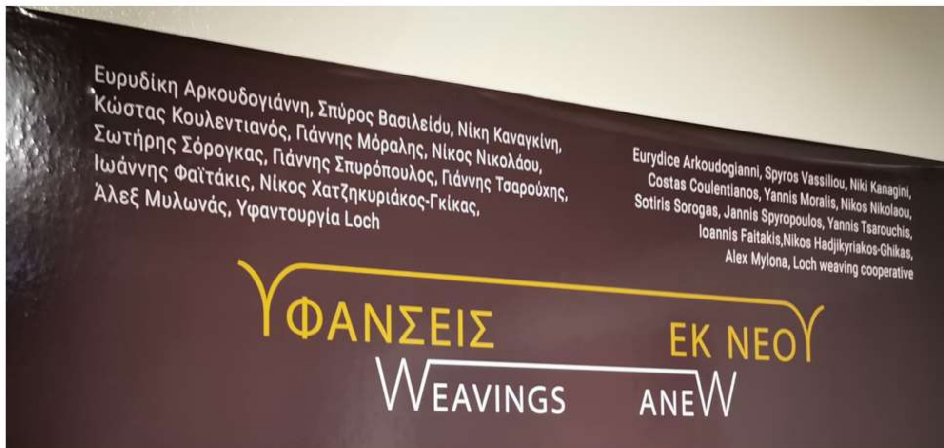
Λεπτομέρεια από το Εισαγωγικό Κείμενο, Έκθεση Υφάνσεις εκ νέου, Μουσείο της Πόλης του Βόλου, 2022