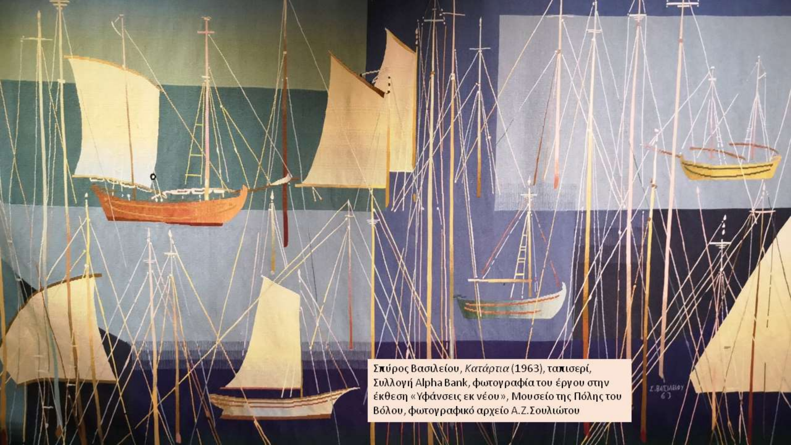
Σπύρος Βασιλείου, Κατάρτια (1963), ταπισερί, Συλλογή Alpha Bank, φωτογραφία του έργου στην έκθεση «Υφάνσεις εκ νέου», Μουσείο της Πόλης του Βόλου